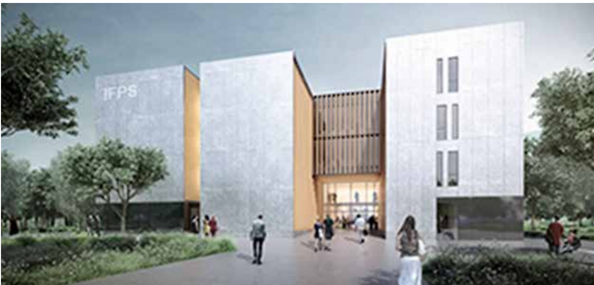
L'Institut de Formation des Professionnels de Santé (IFPS) abritant depuis 2019 le Département de kinésithérapie sur le campus de l'Université Grenoble Alpes.

Depuis 2015, en partenariat avec l'UFR de médecine, les étudiants MK ont la possibilité de suivre un double cursus en master 1 « ingénierie de la santé ».