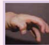
Main en griffe