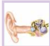
Infections ORL récurrentes