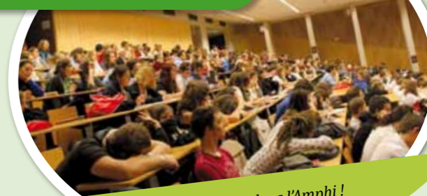
AG et colloque : dans l'Amphi ! Chaque jour un peu plus dur...