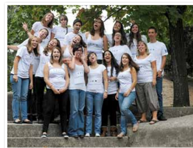
Les L1 de Marseille