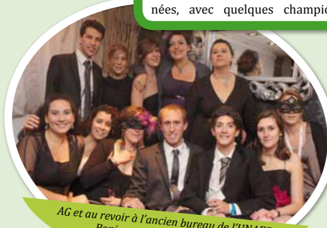
AG et au revoir à l'ancien bureau de l'UNAEE Bonjour aux nouveaux élus ! Gala !!!