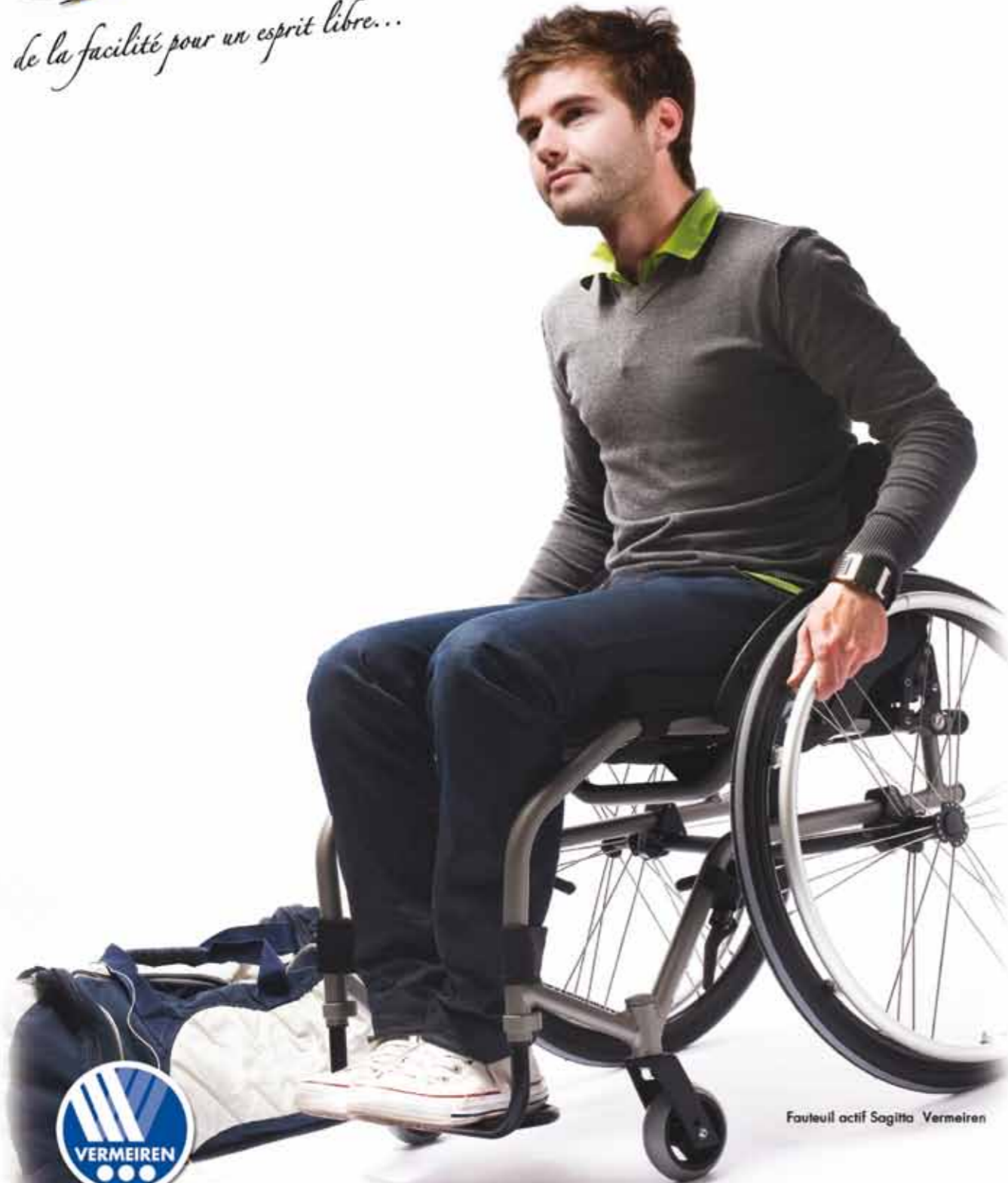
Fauteuil actif Sagitta Vermeiren