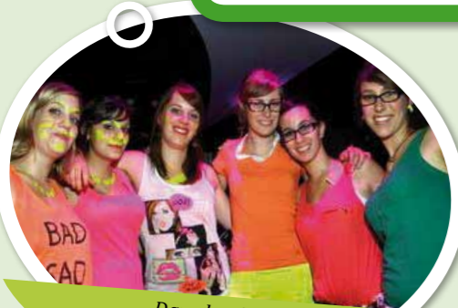
Dans la série : photos de chaque IFEs Soirée Fluo !!

"Trois jours hyper-enrichissants tant au niveau des formations que des rencontres... Merci Lyon et Merci à vous les ERGOS !!! <3"