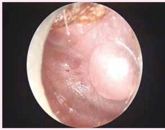
Photo 2 : enfant de 4 ans, douleur vive la nuit, fièvre. Diagnostic ? Traitement ?